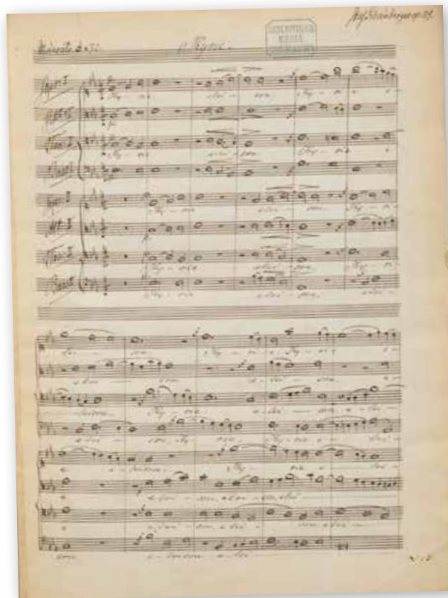
Erste Seite aus dem Autograph der Messe in Es („Cantus Missae“) von Joseph G. Rheinberger (Mus.ms. 4581 der Bayerischen Staatsbibliothek, 1878)